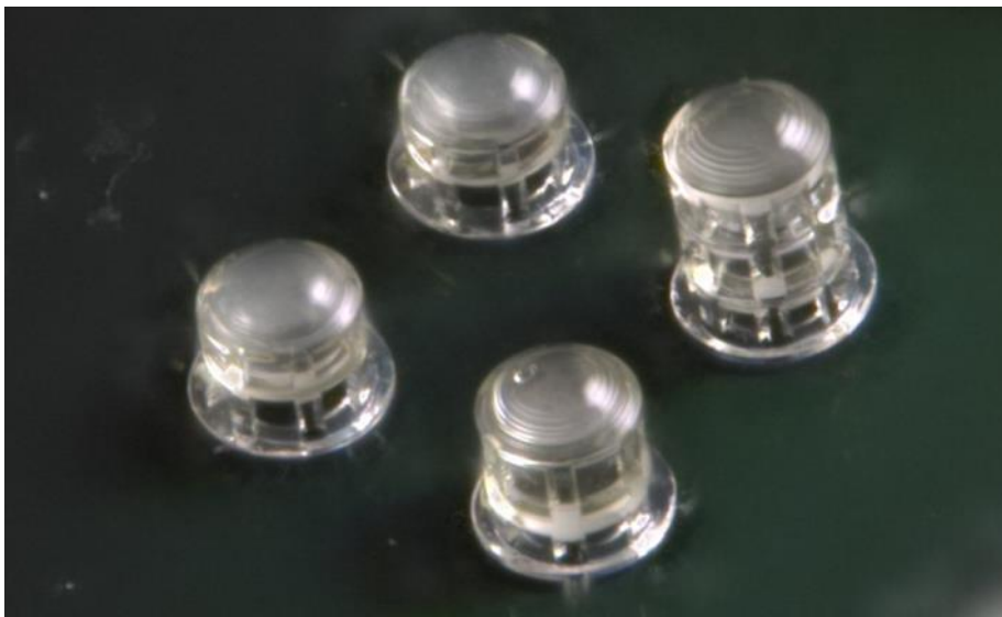
Detailfoto der vier verschiedenen Linsen auf dem CMOS-Sensorchip.