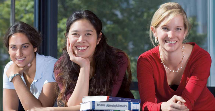
Teilnehmerinnen des Careerbuilding-Programms der Femtec