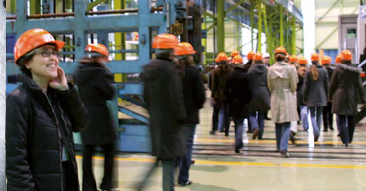
Auf Exkursion – Werksbesichtigung bei der ThyssenKrupp AG

Sie studieren Ingenieur- oder Naturwissenschaften? Sie sind in Ihrem Studium erfolgreich und wollen Ihre Karriere aktiv gestalten?