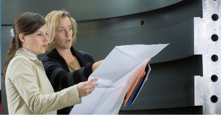
Von Vorbildern lernen – Ingenieurinnen der Siemens AG