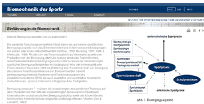
Abb.2: In Abbildung 2 ist eine mit oben genanntem Template erstellte Internetseite dargestellt.[MDW]

Macromedia Dreamweaver 4, http://www.macromedia.com/